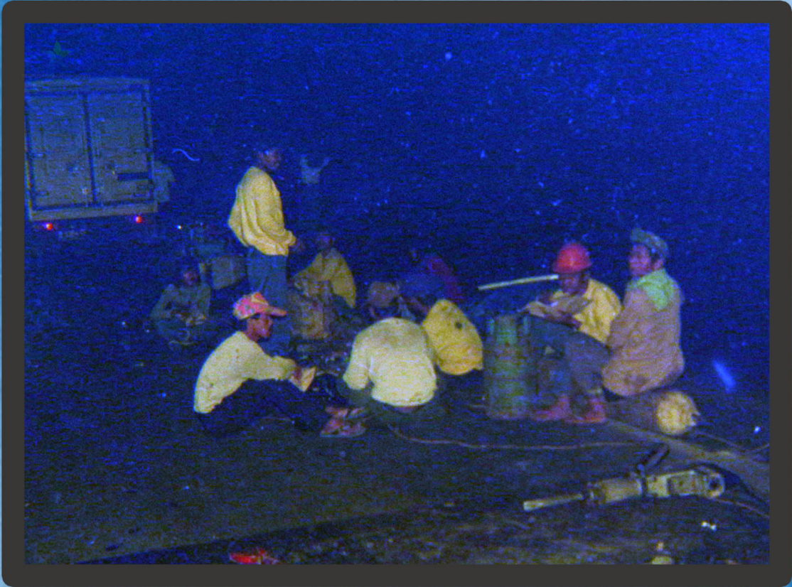
IPPHOS No Induk 43712/PN/Photo/06_01